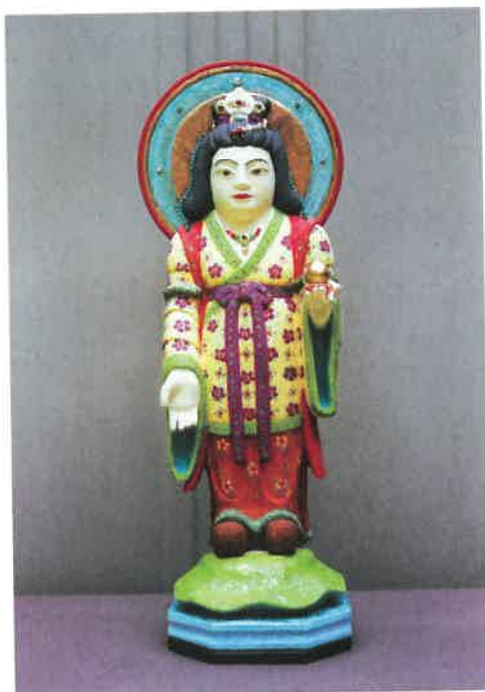
吉祥天 像高 49.8cm