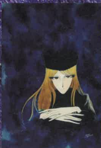
「メーテル」 (直筆原画)