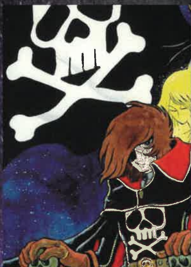
「キャプテンハーロック」 (漫画表紙絵)