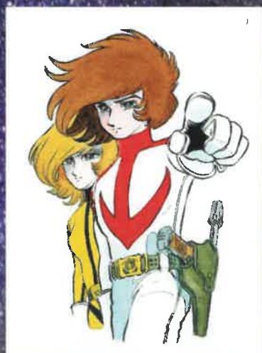
「宇宙戦艦ヤマト豪華版 イスカシタル還か」(漫画表紙絵)