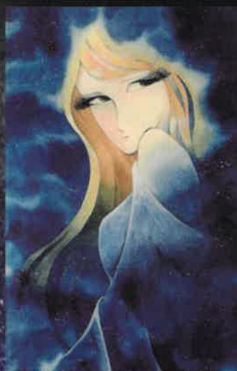
「スターシャ」 (直筆原画)