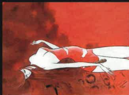
「セクサロイド」 (直筆原画)