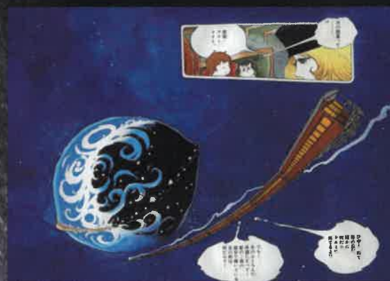
「銀河鉄道999 クルミ割り人形」 (漫画原稿)

1938年、福岡県久留米市生まれ。 本名、松本 辰(あきら)。父は陸軍航空隊のパイロット。 1954年「蜂蜜の冒険」で漫画家デビュー。 1972年「男おいどん」で講談社出版文化賞を受賞。 2001年紫綬褒章、2010年旭日小綬章を受章。 2012年フランス芸術文化勲章シュヴァリエ受章。 代表作に「銀河鉄道999」「宇宙戦艦ヤマト」「宇宙海賊キャプテンハーロック」などがあり、国民的なアニメブームを巻き起こした。