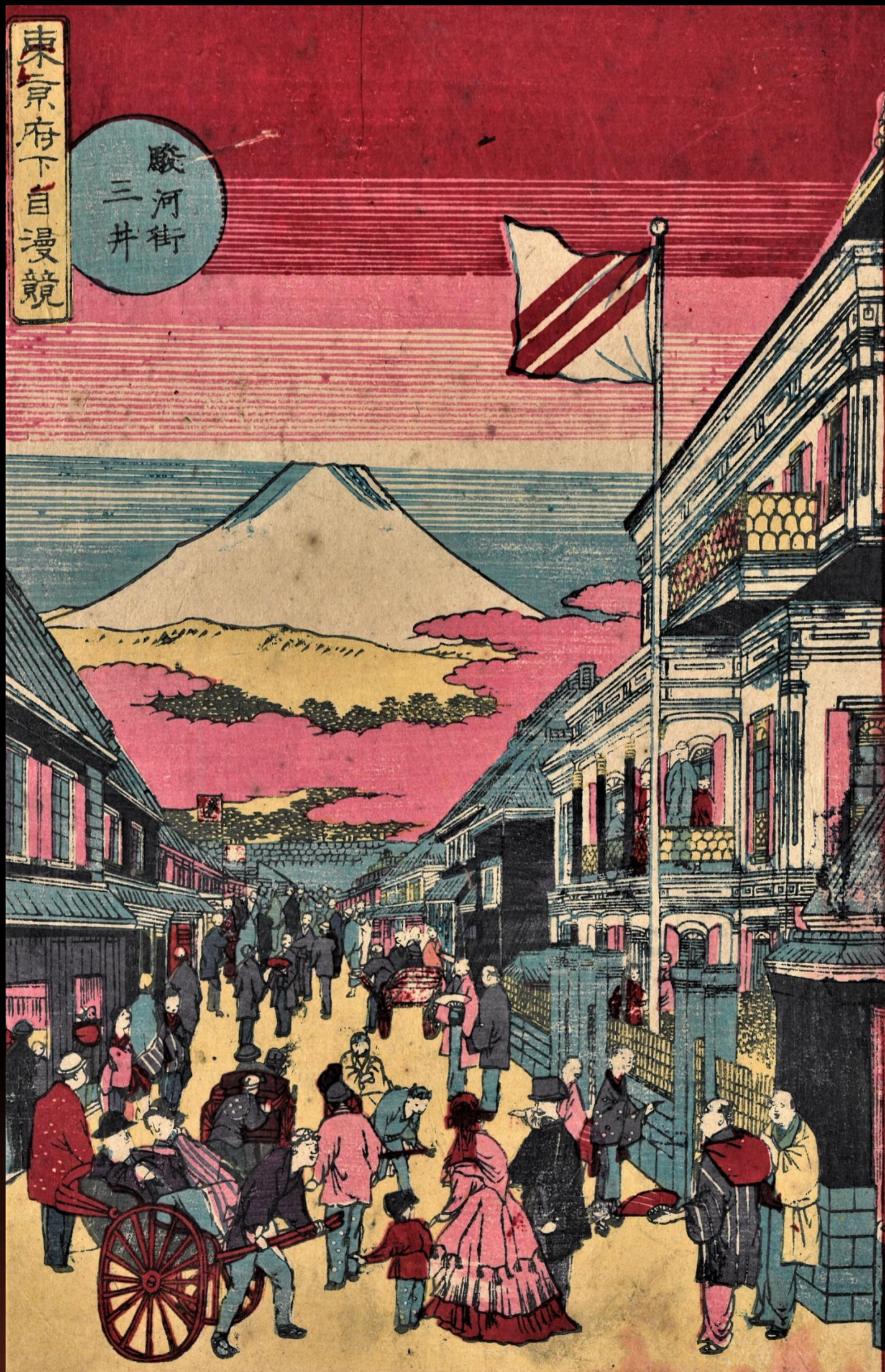
歌川国輝「東京府下自慢競 駿河街三井」

【お問い合わせ】 成田市文化芸術センター 9:00~19:00 (月曜休館) 〒286-0033 千葉県成田市花崎町828-11 TEL 0476-20-1133 FAX 0476-22-7311 URL http://www.narita-bungei-skytown.jp