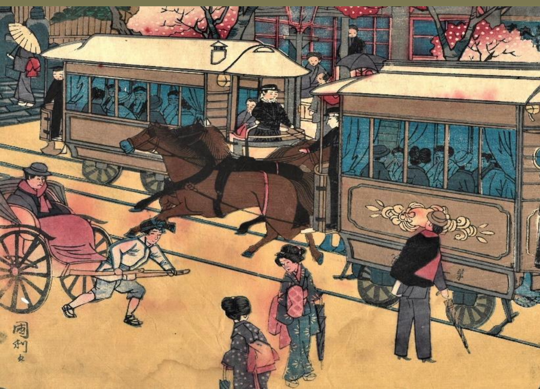
歌川国利「東京銘勝会 銀座通鉄道馬車」より部分