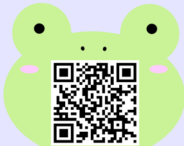
がっきのつくりかた動画