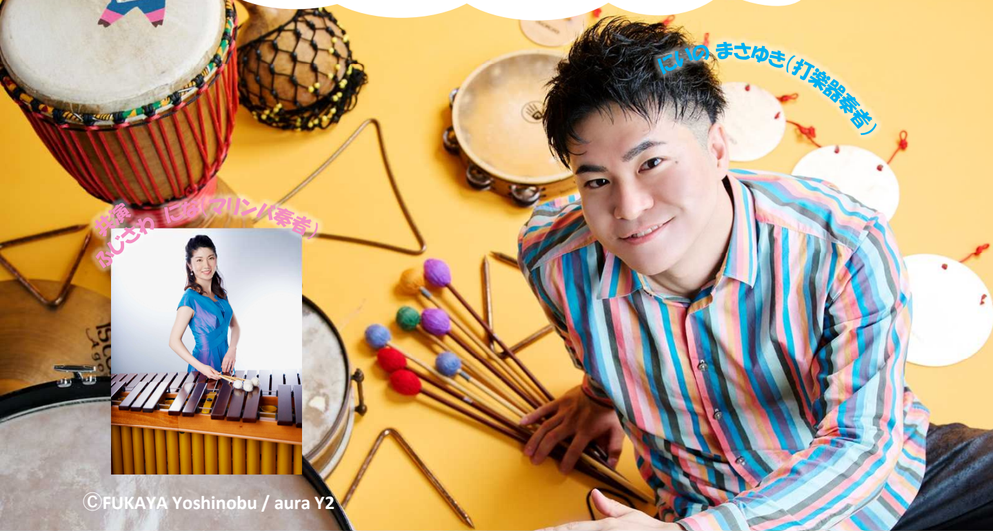
にいのまさゆき(打楽器奏者)