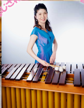
あじさ(マリンバ奏者)