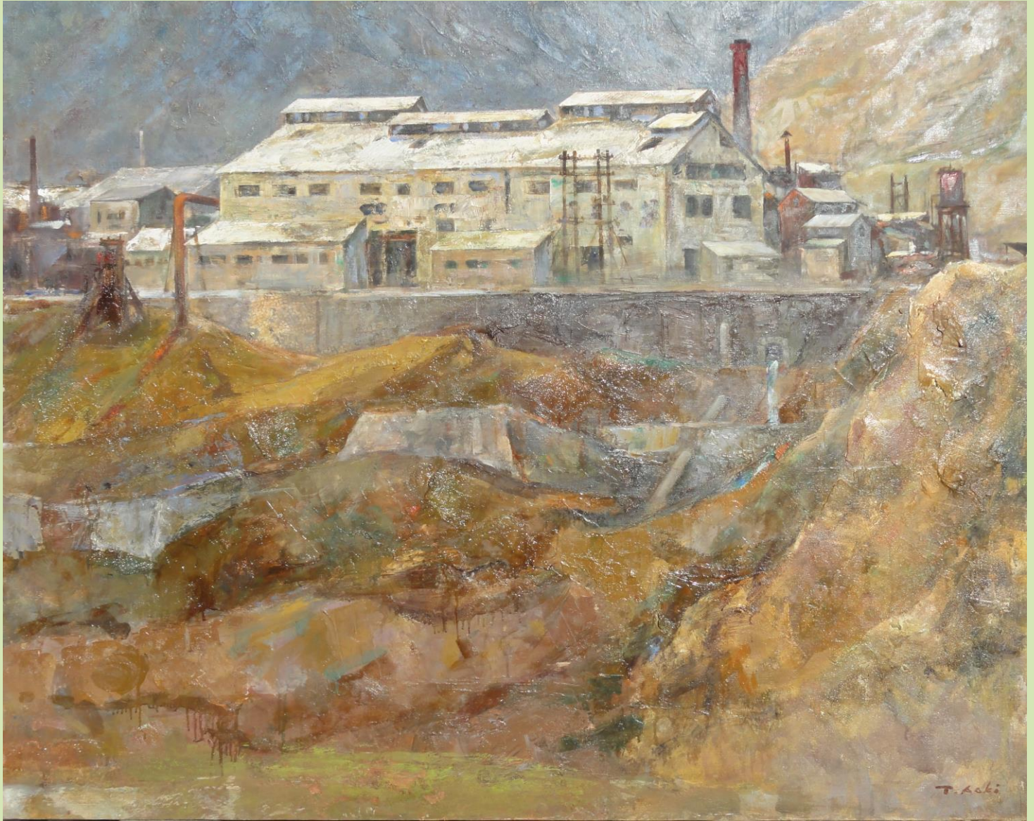
「足尾本山 (F100) 油彩」